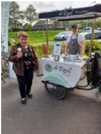
40 jaar Muttathara

Met vrijwillige donaties die zijn gedaan in het kistje bij de kassa voor slachtoffers van de aardbeving in Syrië en Turkije is in twee weken €340,- opgehaald. Dit geld is overgemaakt op giro 555.