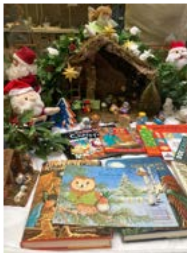
Sinterklaas in de winkel en kerstspullen