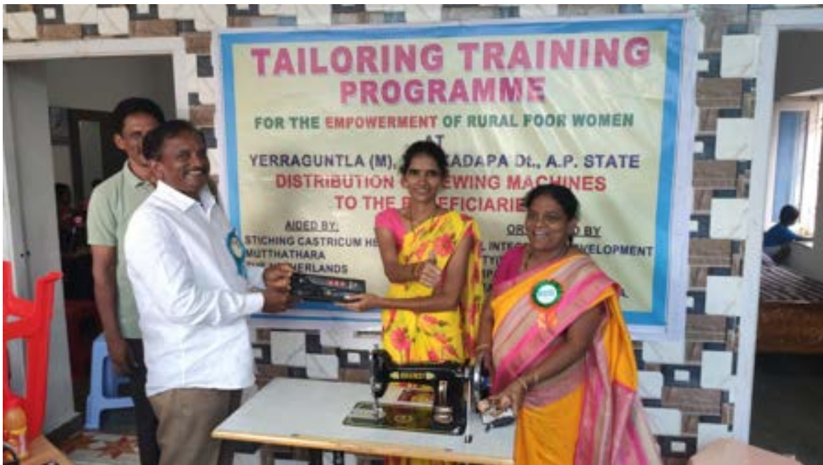
Bijdrage voor het trainen van vrouwen in naaiwerk om in hun eigen onderhoud te kunnen voorzien