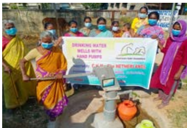
Bijdrage aan SRHED voor de aanleg van handwaterpompen in zes dorpen in India.