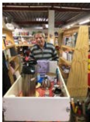
Vrijwillig(st)ers met ingebrachte spullen en met de koffiekar