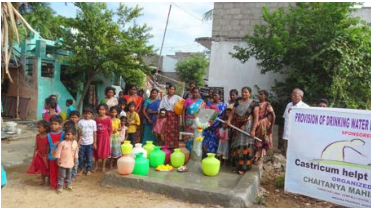
Bijdrage aan CMM in India voor de aanleg van waterputten in 4 dorpen ten behoeve van 2350 mensen.