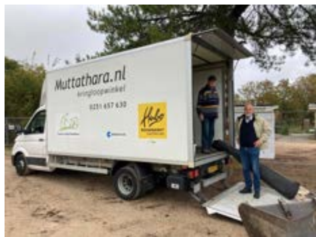
Spullen ophalen op camping Bakkum

Muttathara heeft een weekend met de auto op de camping in Bakkum gestaan om goede spullen mee te nemen die door campinggasten worden weggegaan aan het eind van het seizoen. Het is ook goede reclame voor Muttathara. Bij de aanvang van het volgende campingseizoen komen veel klanten weer van alles bij ons kopen.