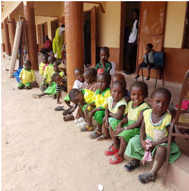
Kinderen op school in Gambia

Ondanks de Coronapandemie is de jaarmzet met beperktere openingsuren in de kringloopwinkel hoger uit gevallen dan in 2021 maar nog niet teruggekomen op het pré-corona niveau. Desondanks konden we mede vanwege de aanwezige opgebouwde reserves toch ingaan op een groot aantal aanvragen.