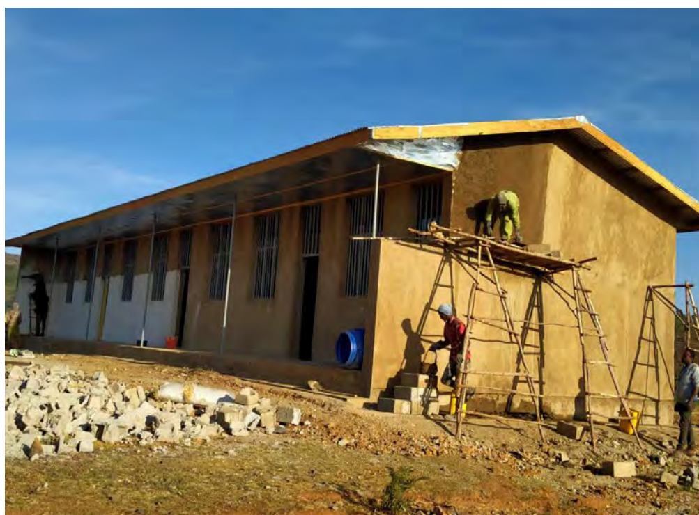
Nieuwbouw school in Ethiopië

De tendens van ondersteuning was dit jaar vooral gericht op drinkwaterprojecten, opleiding en ondersteuning van vrouwen die een eigen bedrijf wilden oprichten om daarmee in eigen onderhoud te kunnen voorzien.