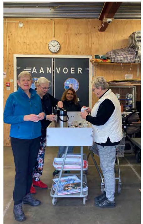
Vrijwilligsters aan de koffie bij de inbreng.