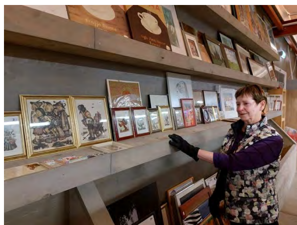
Vrijwilligers: chauffeurs en in de kunsthoek